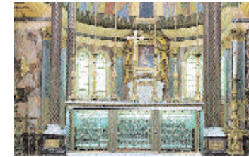
Altar onde repousa o corpo de São Josemaría

No dia 31 de Dezembro de 1959, São Josemaría celebrou Missa em Santa Maria da Paz pela primeira vez. A partir da erecção do Opus Dei como Prelatura pessoal, tornou-se Igreja Prelática. A razão de ser do título desta Igreja e da imagem que a preside é a devoção de Mons. Escrivá a Nossa Senhora. Na cripta da Igreja, ficam a Ca-