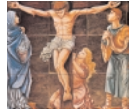
Via Sacra, XII estação: Jesus morre na Cruz. Cerâmica

pela do Santíssimo e os confessionários. São Josemaría incentivou a frequência dos sacramentos da Reconciliação e da Eucaristia, dádivas de Deus aos homens, seus filhos, e fontes de alegria e de verdadeira paz.