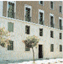
V. Bruno Buozzi, 75

Viale Bruno Buozzi, 75 00197 Roma Telefone: 06-808961