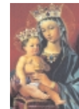
Santa Maria da Paz. Retábulo

Na cripta, está sepultado D. Álvaro del Portillo (1914-1994), Bispo e primeiro sucessor de São Josemaría à frente do Opus Dei.