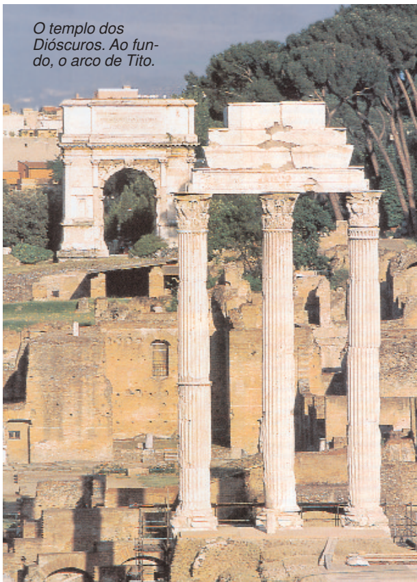
O templo dos Dióscuros. Ao fundo, o arco de Tito.

Negam-se eles a observar as cerimónias públicas e a prestar homenagem a quem as preside? Então que renunciem também a trajar a veste viril, a casar-se, a ser pais, a exercer as funções da vida; então que partam todos juntos para longe daqui; sem deixar deles a mais pequena semente 5 .