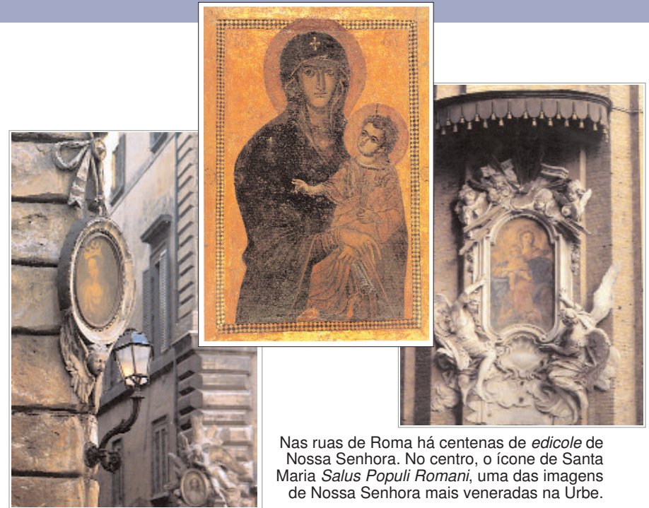
Nas ruas de Roma há centenas de edicole de Nossa Senhora. No centro, o ícone de Santa Maria Salus Populi Romani , uma das imagens de Nossa Senhora mais veneradas na Urbe.

difusão deste costume está relacionada com uma das imagens mais queridas dos habitantes da cidade, venerada na Basílica de Santa Maria Maior e conhecida por Salus Populi Romani . Segundo uma antiga tradição, o nome desta representação deve-se a um milagre ocorrido em 590. Roma fora assolada pela peste, e os seus habitantes levaram em procissão esta imagem desde Santa Maior até São Pedro para implorar o fim da epidemia. Quando passavam junto ao mausoléu de Adriano, apareceu um anjo que metia a espada na bainha, dando a entender que por intercessão da Madonna o mal cessava. Desde esse momento, a fortaleza começou a ser chamada Castel Sant' Angelo, e nas