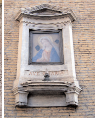
Edicola situada na Piazza delle Cinque Lune.

Na fachada de Via de Vila Sachetti, n. 36, encontra-se uma imagem de Nossa Senhora do Loreto que - por vontade de S. Josemaria - segue esta tradição romana de adornar as fachadas das casas. Em 1957, quando se estava a terminar a construção desta parte do edifício, o fundador do Opus Dei, quis que se pusesse uma Madonnella ao gosto romano, com um suporte para colocar flores e acender lamparinas. Desse modo quem passasse por ali poderia implorar a