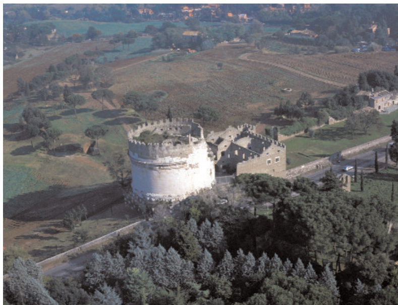
O mausoléu de Cecília Metella, na Via Ápia.